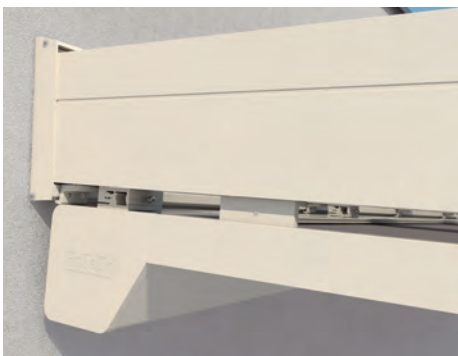
Lignes claires dans la transition entre le caisson et la barre de charge