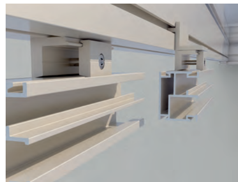
Possibilité de montage affleurant extérieurement ou décalé